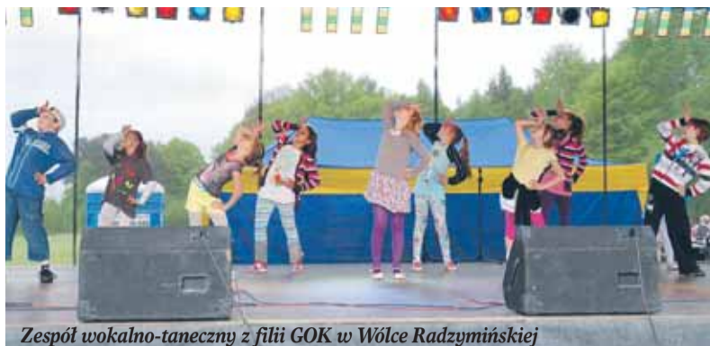
Zespół wokalno-taneczny z filii GOK w Wólce Radzyńskiej