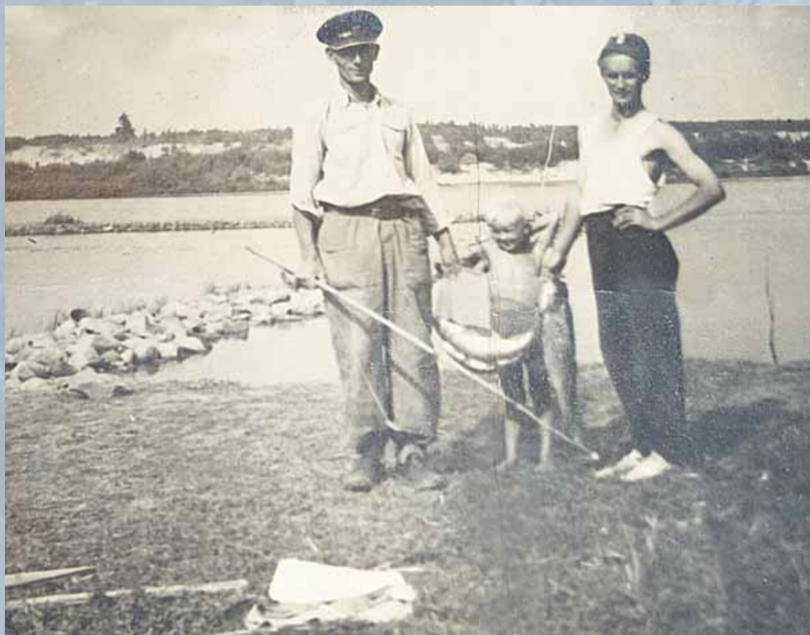
Strażnik wodny w służbowej czapce na Rybakach w Zegrzu Południowym lata trzydzieste