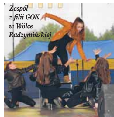
Zespół z filii GOK w Wólce Radzyńskiej