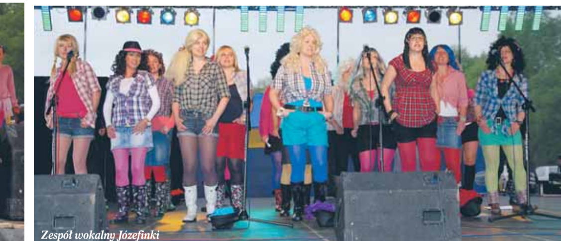
Zespół wokalny Józefinki