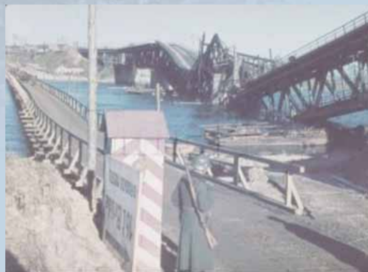
Niemiecki posterunek wartowniczy na przyczółku mostu drogowego w Zegrzu Południowym obok widoczny zniszczony polski most drogowy