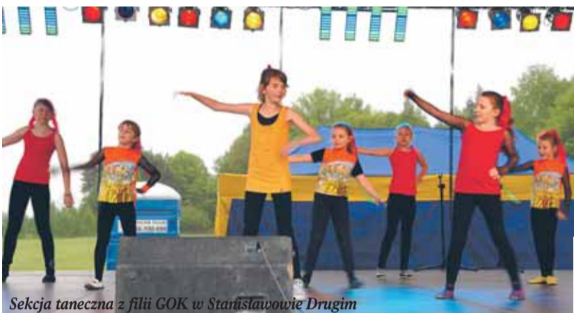
Sekcja taneczna z filii GOK w Stanisławowie Drugim