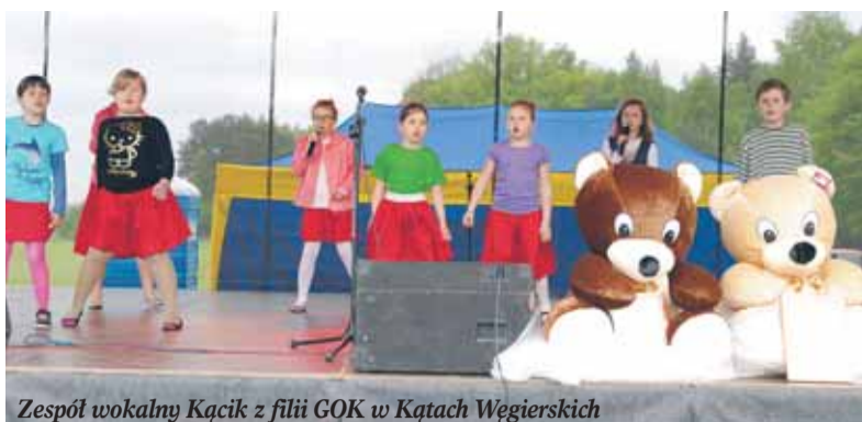
Zespół wokalny Kącik z filii GOK w Kątach Węgierskich