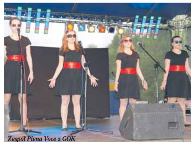
Zespół Piena Voce z GOK