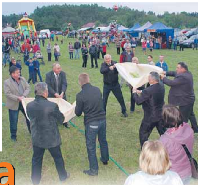
Konkurs dla radnych i sołtysów