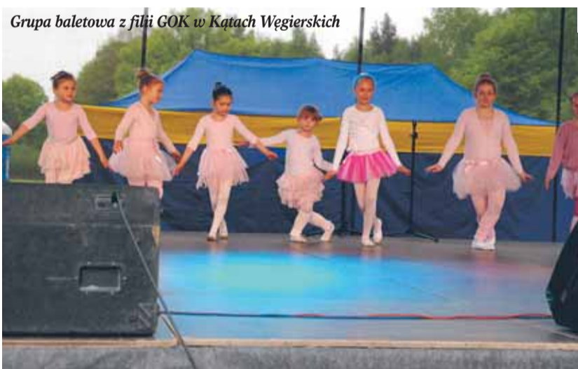
Grupa baletowa z filii GOK w Kątach Węgierskich